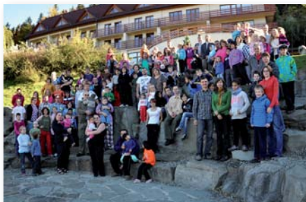
Dny pro náhradní rodiny 2012. Za slunečného počasí proběhly ve dnech 19. a 20. října v Malenovicích Dny pro

100–200 bruslařů denně. Tyto skříňky budou instalovány ve stejné budově přímo na in-line okruhu, kde jsou návštěvníkům k dispozici i toalety. Na jaře se bruslaři mohou těšit na 24 bezpečnostních skříňek a nové vybavení určené k půjčování, konkrétně na 30 párů in-line bruslí, 25 souprav chráničů a 25 bezpečnostních přileb. Hlavní cílovou skupinou je však bezesporu mládež a děti, jež se ocitly na pokraji sociálního vyloučení a jejichž rodiče si nemohou dovolit drahé kroužky či sporty. Navázáním spolupráce s domem dětí a mládeže a s koordinátory nedávno vzniklých komunitních center tak chce město umožnit cílové skupině dětí navštěvovat in-line okruh a areál lesoparku za účelem provozování in-line bruslení. (šs)