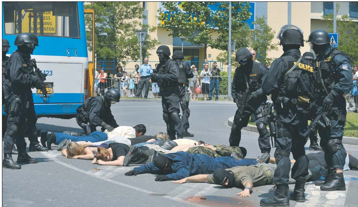
Zásahová jednotka a speciální útvary ČR a Polska předvedly osvobození rukojmích z linkového autobusu, který napadli teroristé.

složky integrovaného záchranného sboru vydaly ze sebe to nejlepší a návštěvníci mohli vidět, co všechno jejich práce obnáší.