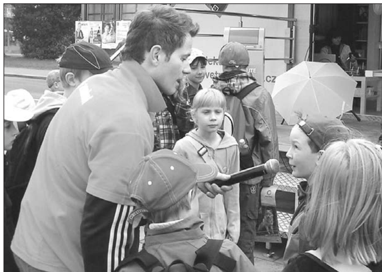
Co ví naši školáci o třídění odpadů, jestli a co všechno třídí doma a ve škole - to bylo jedním z témat Dne Země.

kého Ústavu pro hospodářskou úpravu lesů připravili programy pro 260 dětí z třineckých škol.